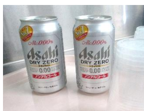
ノンアルコールビール