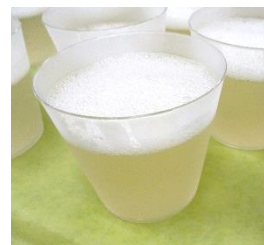
ビール風りんごゼリー