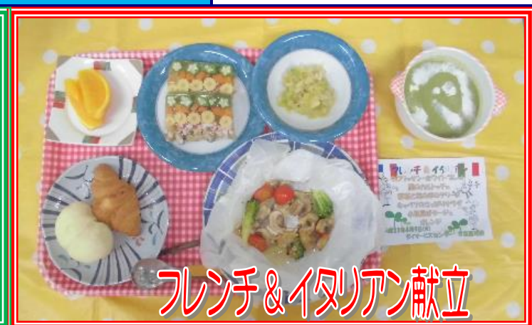
フレンチ&イタリアン献立